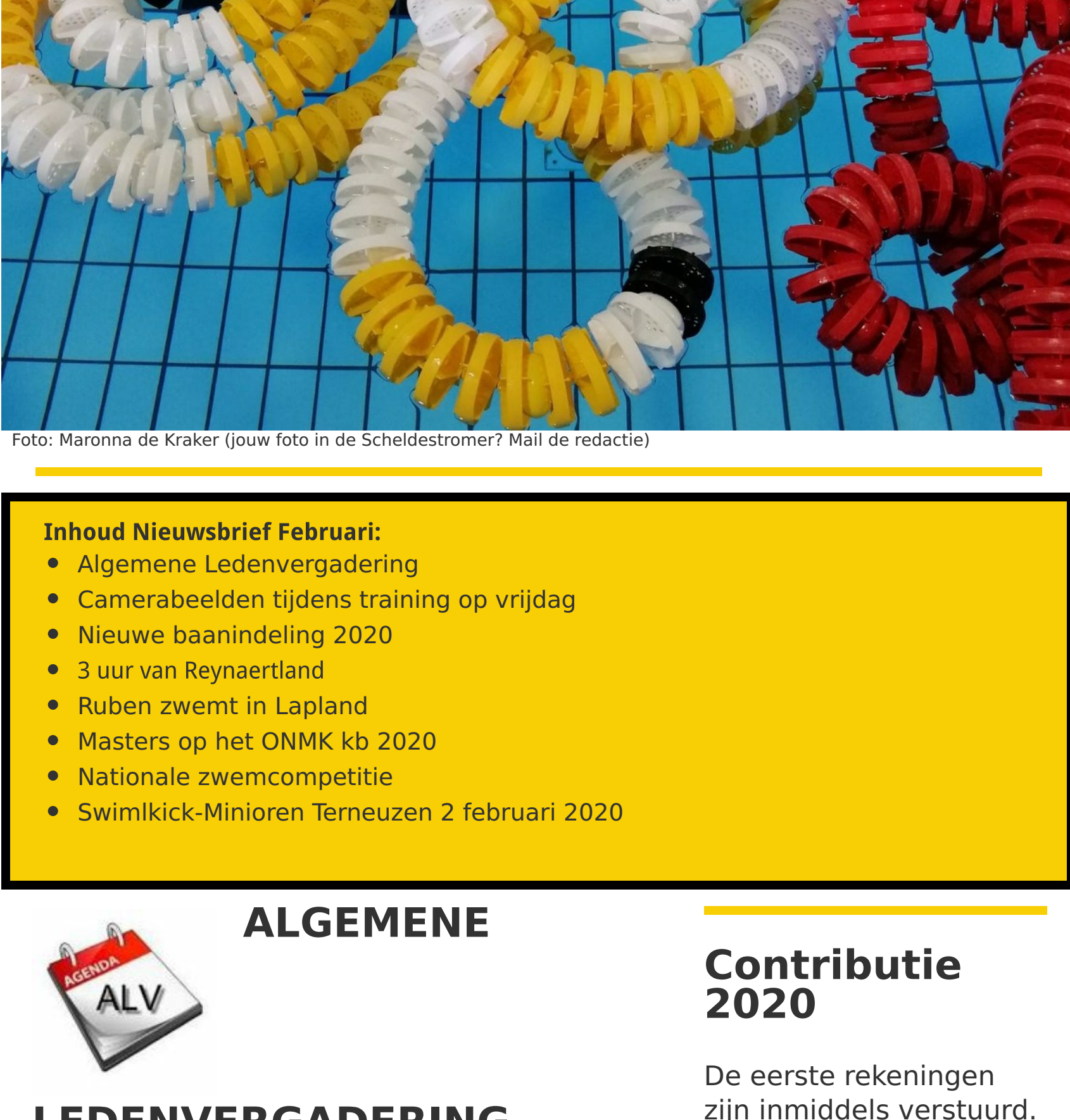
Foto: Maronna de Kraker (jouw foto in de Scheldestroomer? Mail de redactie!)